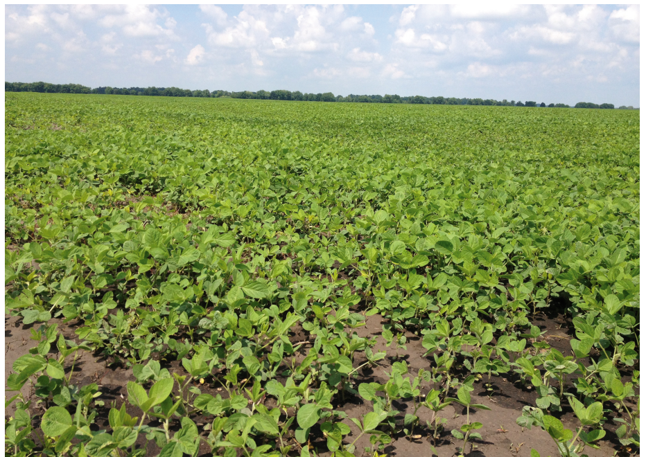
Tiefgründige Schwarzerde Böden, unendliche große Felder und weitaus niedrigere Standards sowie kaum gesetzliche Auflagen ermöglichen die Produktion von Ackerfrüchten zu sehr niedrigen Kosten. Diese Produkte gelangen anschließend ...

Zeitgleich stimmten die Parlamentarier aber mit einer knappen Mehrheit für eine Überprüfung des Abkommens durch den Europäischen Gerichtshof (EuGH). Dadurch verzögert sich der Ratifizierungsprozess erheblich, da die Dauer für die rechtliche Prüfung durch den EuGH unklar ist und zwischen 16