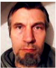
BBK Murtal Gerhard Ederer St. Georgen ob Judenburg