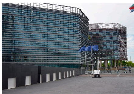
Markante Verwaltungsgebäude im Europaviertel.