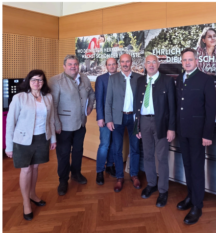
Ein Antrag zu diesem Thema wurde bei der Vollversammlung der LLK NÖ am 27. April 2026 zur Abstimmung gebracht und hat leider keine Mehrheit gefunden.

Eigentlich sollte der Umweltausschuss des Europaparlaments (ENVI) am 5. Mai über den Gesetzesentwurf zu Neuen Gentechnik (NGT)-Pflanzen abstimmen. Dies ist aufgrund der vielen Änderungsanträge vertagt worden. Insgesamt sollen 37 eingereicht sein und könnten bei der nächsten regulären Sitzung des ENVI – die am 1. oder 2. Juni stattfinden soll – behandelt werden. Danach wird das Plenum des Europaparlaments über den Gesetzesentwurf zur Deregulierung von NGT-Pflanzen abstimmen, das könnte in der Sitzungswoche vom 15. bis zum 18. Juni sein.