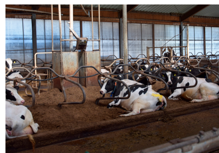
Die Kühe fühlen sich auf Pferdemist und Kalk wohl.

onen: das Europäische Parlament, den Europarat und den Europäischen Gerichtshof für Menschenrechte. Wir besichtigten das Europäische Parlament, das derzeit 720 Abgeordnete umfasst. Aus Österreich entsenden FPÖ sechs, ÖVP und SPÖ jeweils fünf, NEOS und Grüne jeweils zwei Abgeordnete. Der EU-Abgeordnete Roman Haider skizzierte die Arbeit der FPÖ-Mandatare, die der drittstärksten Fraktion „Patrioten für Europa“ mit 84 Abgeordneten angehören.