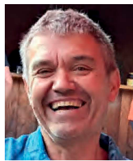
BBK Deutschlandsberg Anton Ertl Groß St. Florian