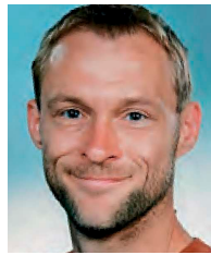
BBK Leoben Wolfgang Judmaier Trofaiach